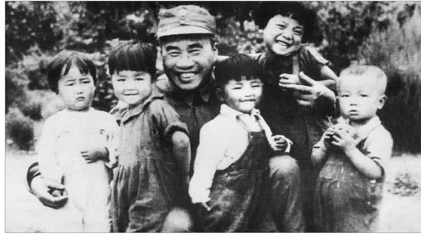
朱德总司令同延安保育院孩子合影 资料照片