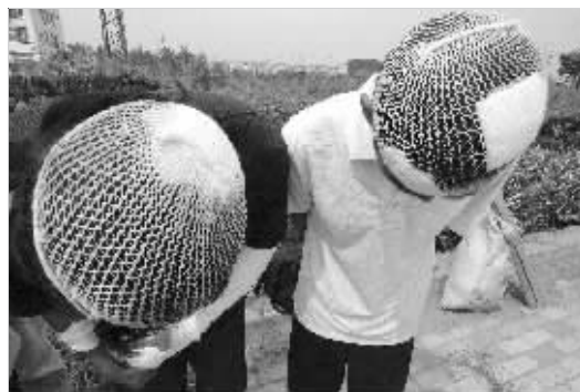
两民工说,头是被领班等人打伤的

“我们都是被工地刺龙画凤的工人打伤的,现在连饭都没吃,已在路边睡了一个晚上,到现在也没有处理。”昨天上午,5名安徽籍民工忍着伤痛,向记者吐苦水。