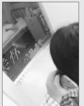
手术前,小玲探望妹妹