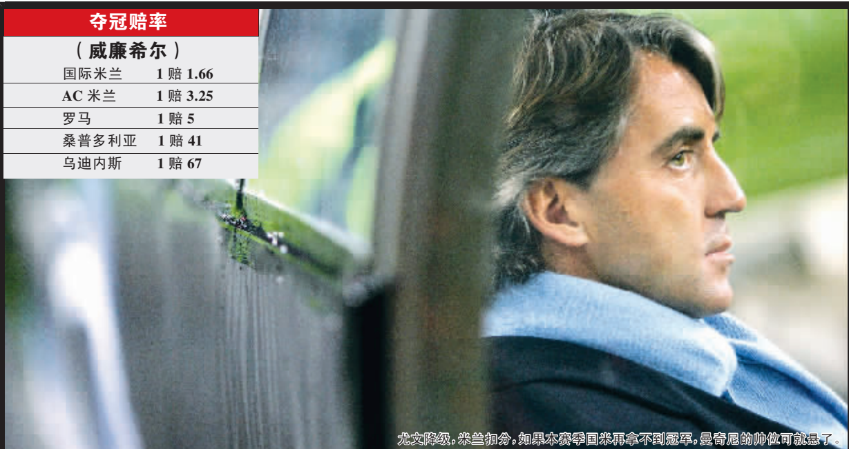
尤文降级,米兰扣分,如果本赛季回来再拿不到冠军,曼奇尼的帅位可就悬了。