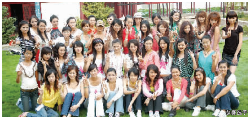
近日,江苏镇江迎来了一批青春靓丽的客人,她们是参加9月16日举行的2006“施尔美杯”时尚电视国际模特大赛中国总决赛的选手们。这几天,记者跟随着这些从全国各地精心选拔出来的选手训练、拍外景,一起感受着大赛前的紧张气氛。