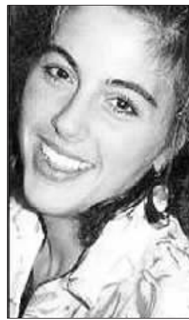
美国已故女“植物人”特里·夏沃

发现可以帮助医生诊断许多仍有意识的“植物人”。不过欧文也承认,这个案并不能证明所有的“植物人”都有相似的意识。但不管如何,当家人跟“植物人”说话时,也许“植物人”会听到他们的声音!