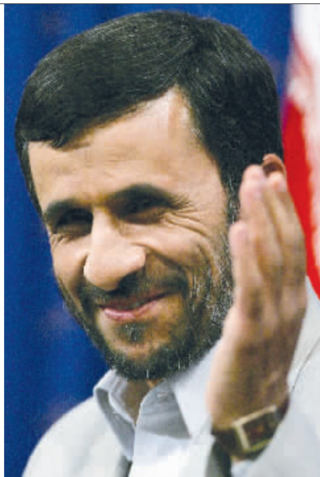
左:美国总统布什 右:伊朗总统马哈茂德·艾哈迈迪-内贾德