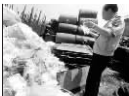
“梅毒患者血袋”惊现垃圾收购站

□据《东南快报》报道 各种注射液袋粘在一起发出阵阵异味,有的已经发霉,而用过的血浆袋内,变了色的血有的已经凝固……这是26日下午,福州环保部门和盖山派出所在一无名废品收购站执法检查时见到的一幕。