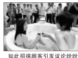
如此招徕顾客引发议论纷纷

□据《华商报》报道 大庭广众之下,浴缸边萨克斯手吹奏乐曲,男女主人公穿着泳衣走进浴缸“鸳鸯戏水”。一商家这种招徕顾客的方式,引得市民议论纷纷,褒贬不一。