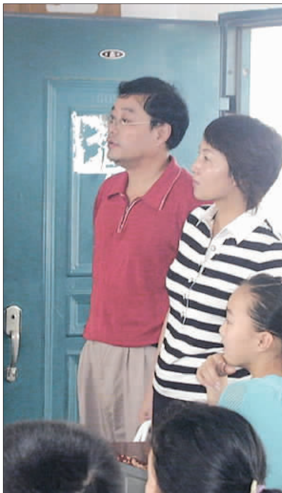
“小升初”,牵动多少人的神经 (资料图片)

发生在徐州三十四中的此次风波,也许不会只是第一起,也绝对不会是最后一起。其实,在社会评判此事是非对错的时候,比这个事情更让人关注的是,优质教育资源的供给和需求矛盾到底应该如何有效平衡?而对这种资源需求强烈的家长,如何也能有秩序地遵守这种“游戏规则”? 快报记者 邢志刚