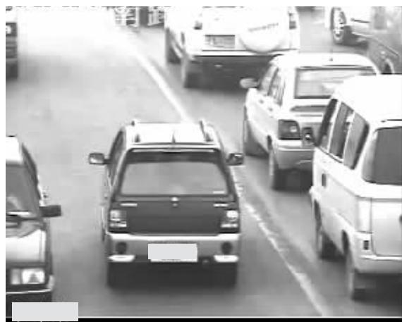
反道超车使大桥更易堵车

每天早高峰,大桥通行难已经成了南京人人皆知的“规律”。经过长时间的调研后,交管部门发现,除了大桥桥面窄、车道少等客观原因外,驾驶员反道超车则是造成拥堵的重要原因之一。“这些违法行为要坚决查处,但不能因为现场查处加剧拥堵!”为此,交管部门将利用警务通、监控录像、移动电子警察等高科技手段,进行先摄录后处罚。