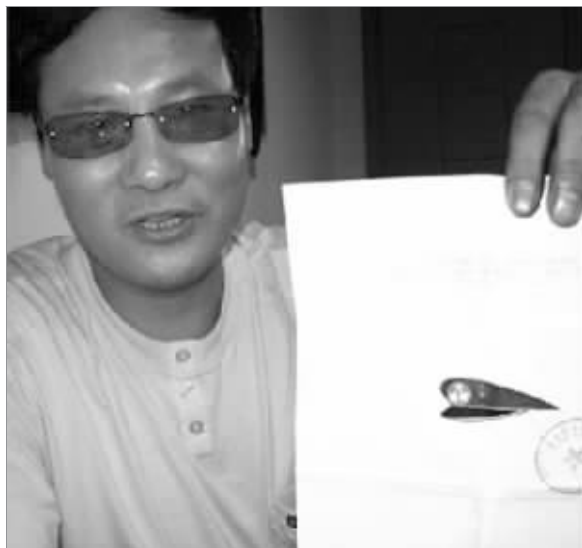
大盖帽商标申请的照片

昨日,记者获悉“大盖帽”已在苏州被申请注册商标,内容包括助听器、杀菌消毒器械、救护担架等类别,其中还包括避孕套产品。该商标代理机构负责人表示,目前这项商标确实已经申报到国家商标局,至于是否能够通过,她认为“比较危险”。