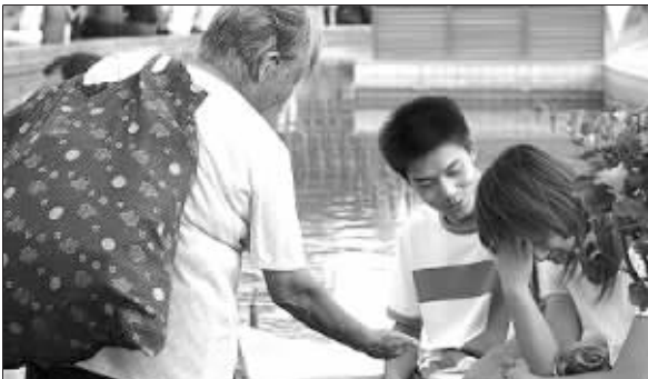
街头上的乞讨 资料图片