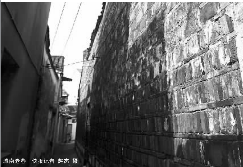
城南老巷