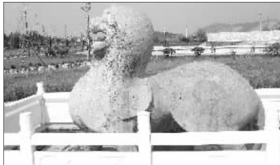
江宁上坊镇石刻

一直以来,陈武帝陈霸先的帝陵所在地被认为是江宁的上坊镇,因为他墓前的一对石兽至今还屹立在上坊镇的石马冲。不过,近日,陈武帝帝陵安在上坊镇的说法,遭到了专家的质疑。据悉,江宁区东山街道为了拯救上坊石马冲的一对石刻,斥资300万,将石刻整体提升了近2米高,并以石刻为中心,建立了一个石刻公园。这一举动引起了文物界的关注,有专家到现场考察,就石刻附近有帝陵进行了勘探。结果让人震惊:这一带确实有古墓,但不一定是陈霸先帝陵。