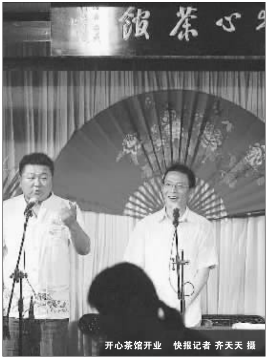
开心茶馆开业

演员。不论是否“专业”,南京相声人有60余号人。只是,以前相声是谋生手段,现在,相声只是一种娱乐方式,人们学相声的劲头大不如前了。而且,现在的相声艺人们,也不完全靠相声吃饭了。