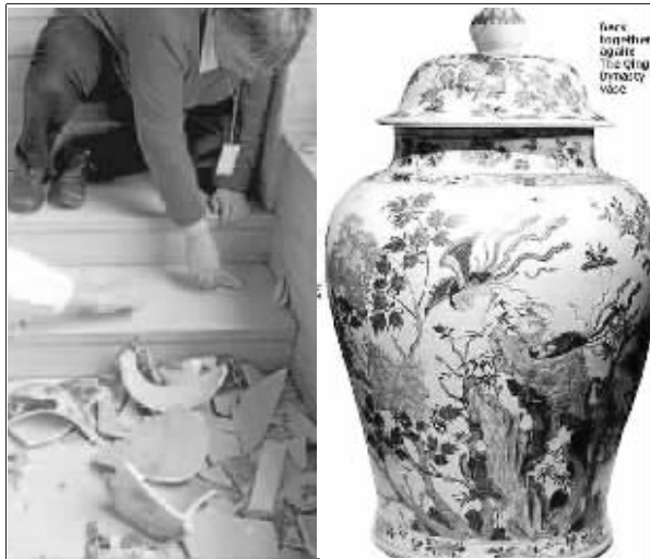
左图:瓷瓶打碎后的模样 右图:113块碎片“还原”出来的瓷瓶

今年1月,英国剑桥菲茨威廉博物馆展出几只17世纪的中国清代瓷瓶时,一名英国游客不小心摔了一跤,将3只昂贵的中国花瓶撞成了数百块碎片。经过几个月的智力拼图游戏后,英国“拼图大师”目前已经用113块碎片“还原”出了第一只瓷瓶,另外两只瓷瓶有望在圣诞节前重新“复原”。