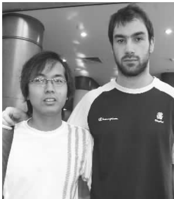
斯潘诺里斯和快报记者合影

斯杯组委会订票热线:025-51889779 订票热线:025-83208320,11185 资讯热线:9695506(免信息费)