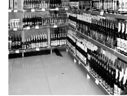
酒店货架上的酒水均标上超市价

在南京的酒店行业,“谢绝自带酒水”、“开瓶费”等消费条款一直属于霸王条款,然而在南京餐饮市场颇有知名度的“世纪缘大酒店”却公然在媒体上表示,自己要做第一个吃螃蟹的人,在其连锁的夫子庙店、光华门店、三山街、新街口店实行酒水饮料超市价供应,并且免掉了食客的“开瓶费”。 “世纪缘”的决策一出,引得南京美食大舞台一片轰动,“争议声”不断。据了解,“世纪缘”的决策一旦实行,所有酒水饮料将比原销售价下调50%，“开瓶费”也是餐饮业的猫腻所在,市民们对“世纪缘”的决策能否长期有效地执行表示怀