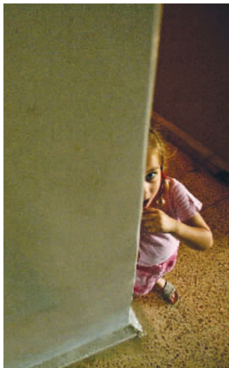
一名黎巴嫩小女孩从避难所的墙后探出头来