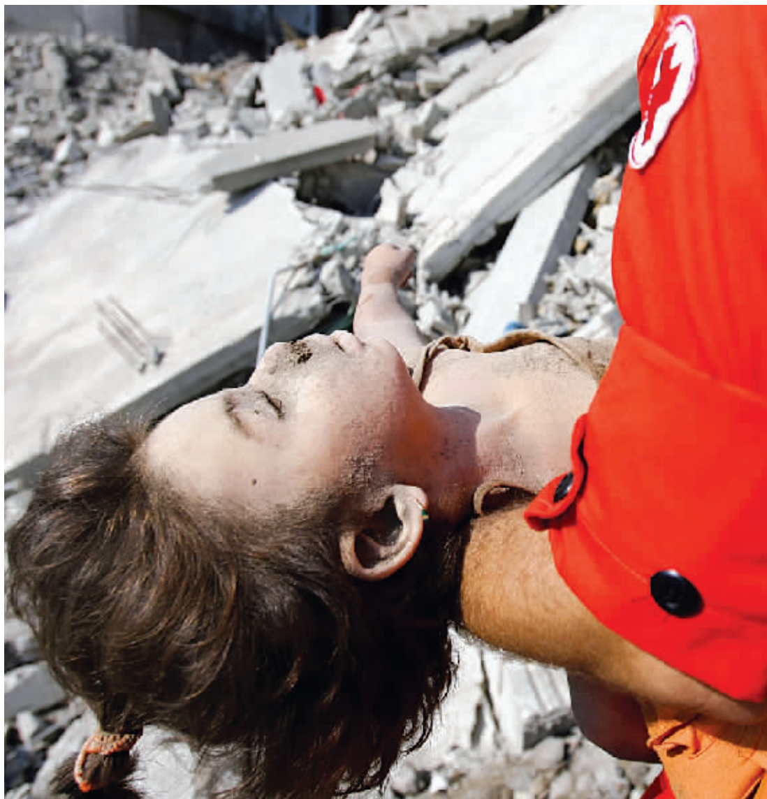
又一名黎巴嫩儿童的尸体被抬了出来