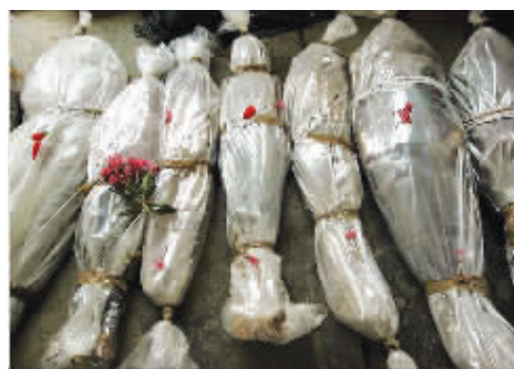
一朵鲜花寄托哀思