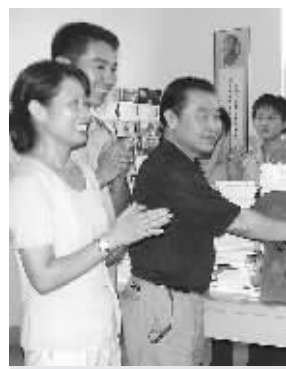
7月27日下午,南京市白下区洪武路街道领导班子全体成员来到解放军第四四四医院勤务连,将400余册、价值10000余元的图书献给子弟兵,鼓励他们立足军营学有所成。