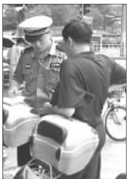
“整治无牌助力车”系列报道③

记者昨天在瑞金路采访时,长期在摩托车店门口做牌照生意的男子告诉记者,因为查处力度加大,现在办牌的价格也上升了两三百元,“这下肯定是动真格了!你今天不买啊,明天价格绝对再涨200元,牌照有限,这是资源,不要可别后悔啊!”