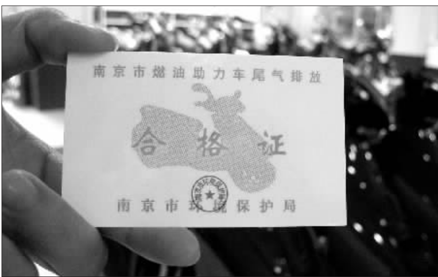
“小天使”助力车销售人员出示南京市环保局颁发的合格证