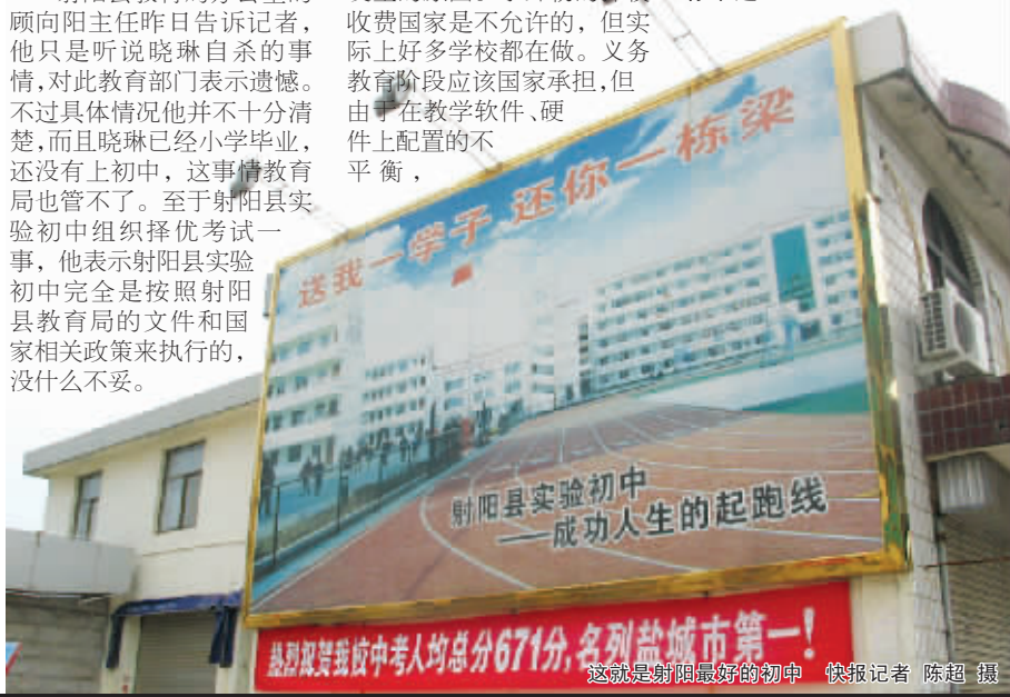
这就是射阳最好的初中