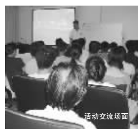
活动交流场面 南医大友谊医院肝病科咨询热线 025-86677999 铃声不断,许多外地肝病患者通过报纸和南京医疗网(www.nmufh.com)得知活动的消息后,通过电话或网络向南医大友谊医院肝病科咨询活动详情和《抗HBV特异性主动免疫疗法》的相关情况,更有不少本地的肝病患者看到介绍后,直接到南京市汉中中路146号南医大友谊医院肝病科上门求治。俗话说:同病相怜。很多先得到消息的肝病患者纷纷把活动消息向其他患者转告,致使得到消息的患者越来越多。