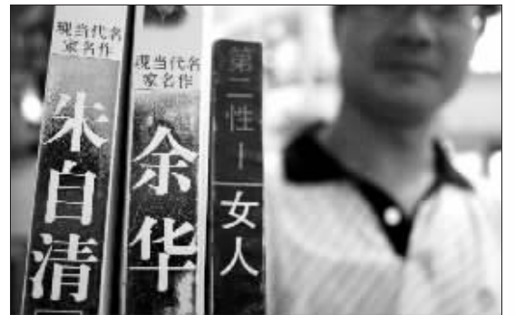
“轻风无忧”重点推荐的三本书

从征集漂书感言开始,三天来收到不少读者的漂书感言,读者“轻风无忧”再次来漂书,还郑重推荐其中三本“好书”,希望这三本书漂到更多人的手中。本周六上午9:00~11:00,快报的“漂”书活动走进瑞阳尊帝门前广场,届时您可以淘到心仪的好书,也可以将家里的书带到现场来捐赠,有好的漂书感言,也可以一起带来哦。