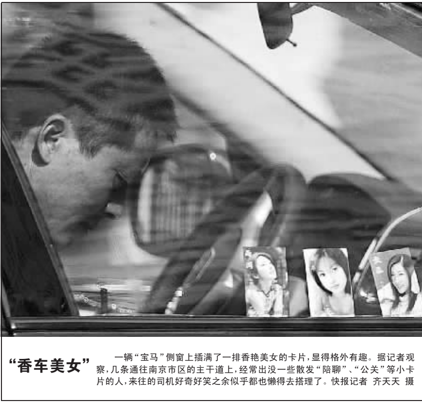
“香车美女” 一辆“宝马”侧窗上插满了一排香艳美女的卡片,显得格外有趣。据记者观察,几条通往南京市区的主干道上,经常出没一些散发“陪聊”、“公关”等小卡片的人,来往的司机好奇好笑之余似乎也都懒得去搭理了。