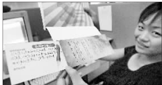
记得写下你的“漂书”感言哦!

书不在看得多,而是要看得精,“你们那里堆了那么多的书,有些人过来挑挑选选,根本无从下手。搞不好回家后,不感兴趣了,就很快又漂了回来。”读者“轻风无忧”说。