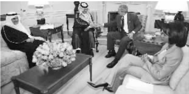
在美国首都华盛顿白宫的总统办公室,美国总统布什(右二)与来访的沙特外交大臣费萨尔亲王(左二)在会谈时握手

美国国务卿赖斯24日开始中东之行,寻求避免中东冲突全面升级。赖斯从华盛顿乘飞机启程,中途在爱尔兰香农机场加油,作短暂停留时说:“建立可以实现停火的条件非常重要。我们认为,停火紧迫,拥有可以让停火持续的条件同样重要。”赖斯说:“我们都希望立即结束这场冲突。我们绝对拥有共同的目标。”但她补充说,如果暴力只停止几星期就卷土重来,“我们从停火中没得到任何东西”。