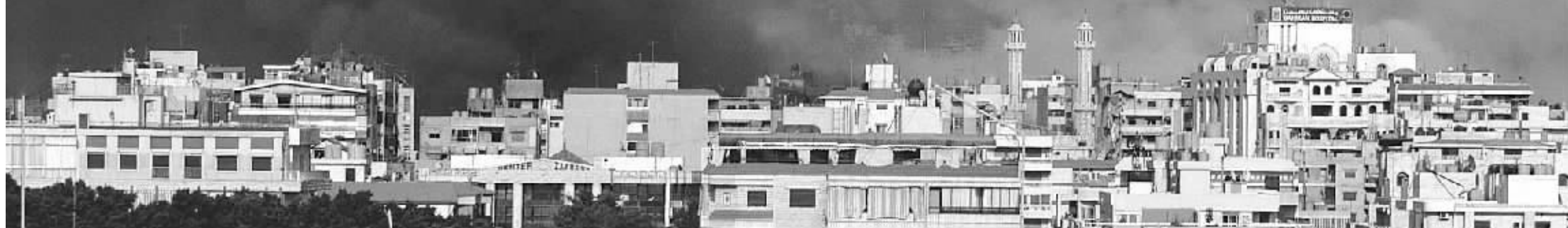
黎巴嫩首都贝鲁特南郊的一处目标在遭到以色列空袭后冒出滚滚浓烟