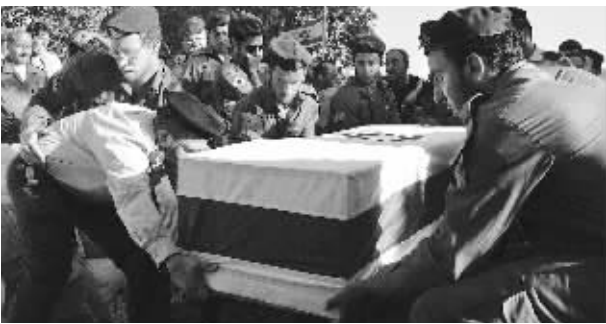
一名以军阵亡士兵的葬礼在以色列北部城镇谢莫纳举行

以色列方面22日向边境地区的黎巴嫩塔伊里村庄的村民发出了最后通牒,要求他们立即撤离,于是许多村民弃家而逃。萨伊塔一家是当地一个什叶大家族,共有54人,家里有3辆小汽车。当以色列的撤退令下达的时候,他们最初还不想离开家园。但是,当22日晚上7点钟撤离的最后期限已过时,看到邻居纷纷四散逃命,这个大家庭也开始有些惊慌。于是,23日早上,这一家54口人踏上了逃亡之路,他们分乘3辆小型货车离开了家园。悲剧正是从这里开始的,他们“错误地”选择了交通工具。以色列在其散发的传单中已经警告说,小型货车、卡车和摩托车都会成为他们首选的袭击目标。 23日上午10时左右,炸弹击中了正在逃亡之路上的萨伊塔家的一辆小型货车,当场