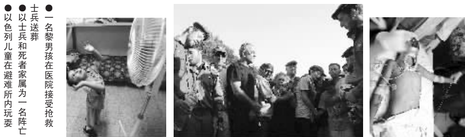
●一名黎男孩在医院接受抢救 ●士兵送葬 ●以士兵和死者家属为一名阵亡 ●以色列儿童在避难所内玩耍