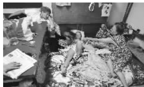
●医护人员在安慰以色列小女孩 ●受伤的巴平民被送往医院 ●以平民在避难所内休息