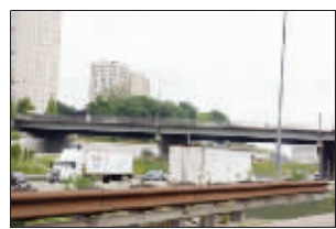
蒋国兵自杀的地方