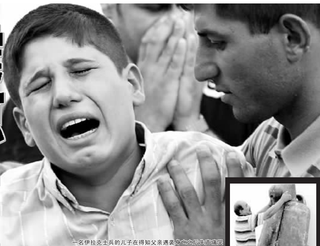
一名伊拉克士兵的儿子在得知父亲遇害身亡之后失声痛哭

7月15日,一伙身份不明的武装分子闯入巴格达石油部文化中心,将正在那里举行会议的伊拉克奥委会成员连锅端,包括奥委会主席在内,伊拉克的体育精英和报道会议的多名记者共计50余人悉数被绑架。