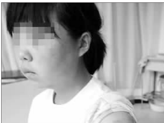
女孩脸上及胳膊上的伤痕清晰可见

□据《西部商报》报道 13日,记者接到读者投诉称,4名女生对一个腿部有残疾的同班女生进行了长达5小时的殴打和威胁。在长达5小时的时间里,被打者因负伤和害怕,始终未敢大声喊叫。目前,甘肃省榆中县和平镇派出所正在积极调查此案。