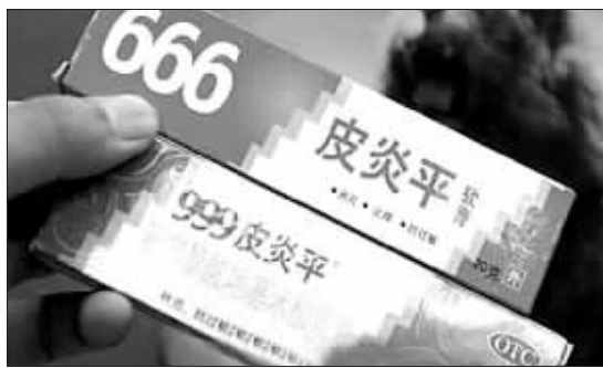
包装极为相似的两种皮炎平

□据《武汉晨报》报道 一种666皮炎平软膏的外包装与999皮炎平软膏十分相似,湖北汉阳一消费者没留神买错了药,涂抹后导致脸部皮肤发炎。12日,五里墩工商所介入调查。