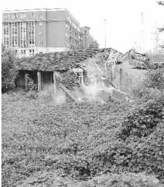
昨天,抢搭的违建房被拆除

投诉内容:最近一两个月来,铁心桥街道尹西村有20多户居民疯狂抢搭违章建筑3000平方米。