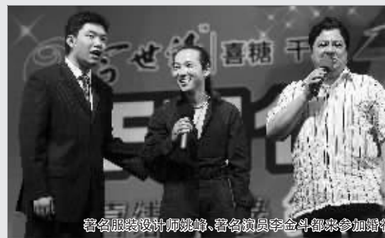
著名服装设计师姚峰、著名演员李金斗都来参加婚礼