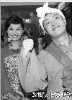
一对新人搞笑出场