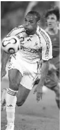
亨利是克洛泽争夺金靴奖的最大对手

数字提高到8个。而本届世界杯，进球最多的克洛泽才打进5个球，现在唯一有希望赶超克洛泽的只有亨利，而他必须要打进三个球才能超越前者，决赛上演帽子戏法的可能性又是微乎其微的。