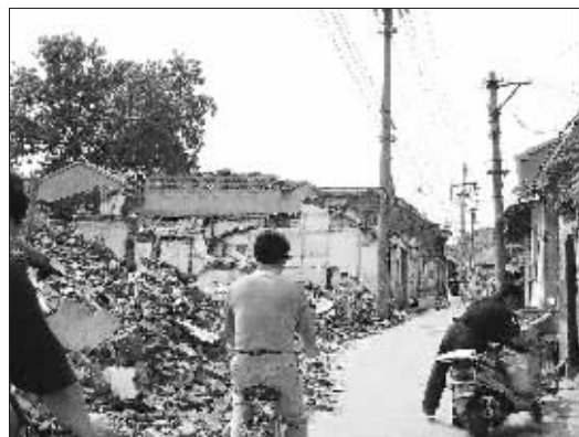
钓鱼台拆迁,地名还能保留多久?

4.地名工作规范化管理的需要。自上世纪80年代初,南京成立了市地名委员会及其办公室后,按照上级业务主管部门的要求,先后针对一些含义粗俗、一地多名、名实不副、地名重复等情况进行了地名标准化处理。如“破布营”因名称不雅,根据附近有“正洪里”的情况,故更名为“正洪营”;“土城头路”因名称土俗,与近代道路的风格不相匹配,根据附近晨光机械厂的情况,故更名为“晨光路”。