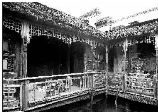
城南糖坊廊61号清代古民居保存较好的建筑雕饰。