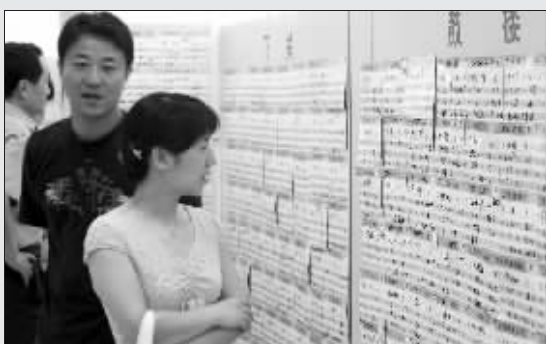
市民在“跳蚤市场”寻找房源。

那么,二手房“跳蚤市场”,又是靠什么来维持正常的运营支出呢?该市场经理樊益君表示,“跳蚤市场”的赢利点是帮助双方过户,每笔收取800元的委托费。服务内容委托市场代办贷款、抵押、过户等手续的费用。“如果买卖双方不愿意,也完全可以自主选择交易。”