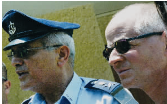
以军总参谋长哈卢茨(左)与沙利特的父亲接受媒体采访

巴龙说:“哈马斯非常了解以政府的妥协立场,如果他们伤害沙利特,天会塌下来砸到他们身上。”