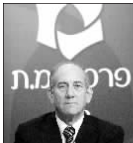
以色列总理奥尔默特

巴以冲突升级以来,埃及一直积极从中斡旋希望能够化解这场危机。据以色列《国土报》的报道,埃及总统穆巴拉克已经向哈马斯设定最后期限,希望他们